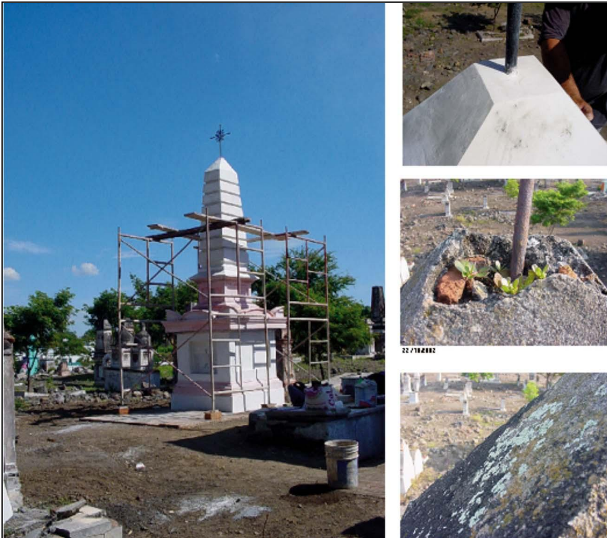
Diferentes etapas del proceso de restauración.